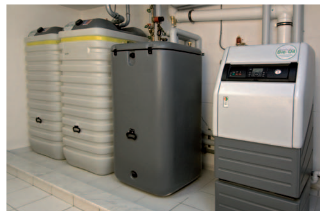
Moderne Ölbrennwertheizung mit Wärmespeicher in Kombination mit Öl-Sicherheitstanks