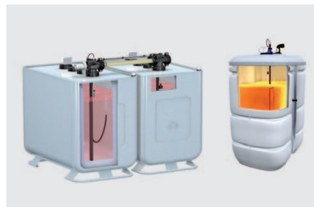
Beispiele von modernen Öltanks mit Geruchssperre

Der Nutzer einer Ölbrennwertheizung entscheidet selbst, zu welchem Zeitpunkt er welche Menge an schwefelarmem Heizöl bezieht und lagert. Er ist somit unabhängiger als die Bezieher leitungsgebundener Energien.