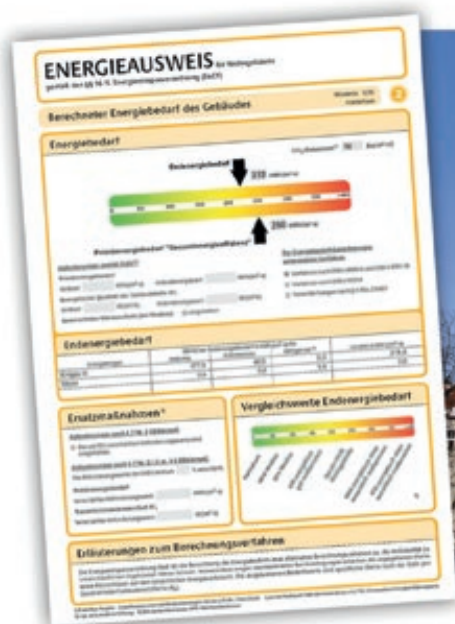
Der Energieausweis für Gebäude gibt Aufschluss über den energetischen Ist-Zustand einer Immobilie.