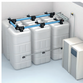
Doppelwandige Sicherheitstanks gibt es in Kunststoff/Kunststoff- und Stahl/Kunststoff-Ausführung und können platzsparend im Heizraum sicher aufgestellt werden.