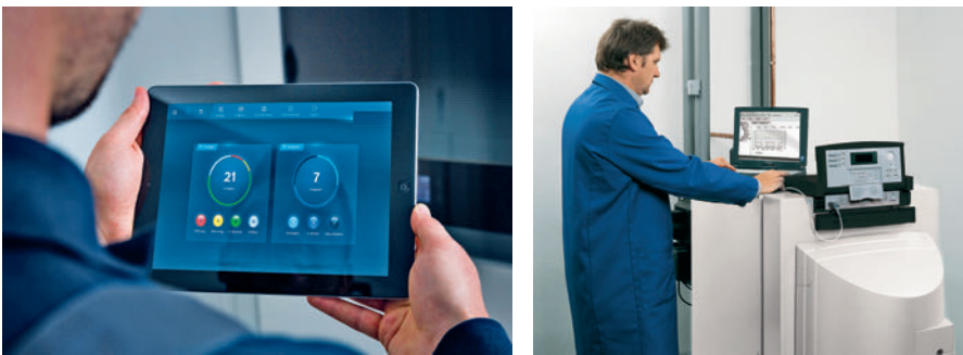
Abb. 4: Die Heizung kann über ein Tablet oder einen Computer einfach überwacht werden, wo und wann der Fachhandwerker will

Die Aufschaltung einer Heizungsanlage ist somit unkompliziert und in kurzer Zeit durchführbar. Der Fachhandwerker hat nun die Heizungsanlage im Blick und erhält für Serviceeinsätze die benötigten Informationen. Je nach Umfang der durch den Hersteller angebotenen Funktionen können dies Fehlermeldungen, Angaben über mögliche Fehlerursachen, Reparaturzeiten sowie benötigte Ersatzteile sein. Serviceaufträge können direkt mit allen wichtigen technischen Informationen erstellt und als kompletter Arbeitsauftrag an den Techniker gesendet werden. So lassen sich die Serviceeinsätze effizient gestalten und können schon beim ersten Kundenbesuch erfolgreich sein. Dies spart Geld und Zeit. Auch Wartungsarbeiten an Heizungsanlagen lassen sich durch die Aufschaltung der Heizungsanlage wesentlich schneller durchführen. Dies stärkt die Kundenbindung. Der Betrieb nach dem deutschen Datenschutzrecht (BDSG), den weltweit schärfsten Bestimmungen, sorgt für die benötigte Datensicherheit.