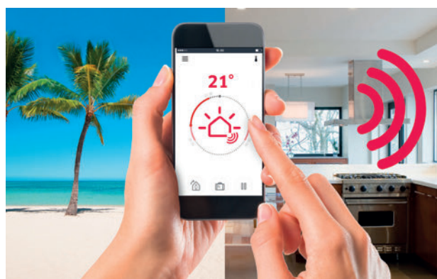
Abb. 3: Steuerung und Beobachtung der Heizungsanlage über eine App

Der Anlagenbetreiber kann nun die Heizungsanlage von überall und zu jeder Zeit über die App steuern. So können z. B. die Raumtemperatur im Gebäude eingestellt sowie Temperatur- und Verbrauchswerte aus der Ferne abgerufen werden. Der Anlagenbetreiber erhält hierdurch das sichere Gefühl, dass mit seiner Heizung alles in Ordnung ist.