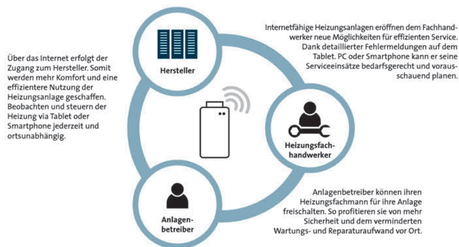
Abb. 1: Digitaler Heizkomfort über das Internet

Im Folgenden werden die Lösungen aufgezeigt, welche dem Fachhandwerker derzeit von den Herstellern angeboten werden. Hierbei werden konkrete, praktische und einfach umzusetzende Hinweise für das Fachhandwerk gegeben.